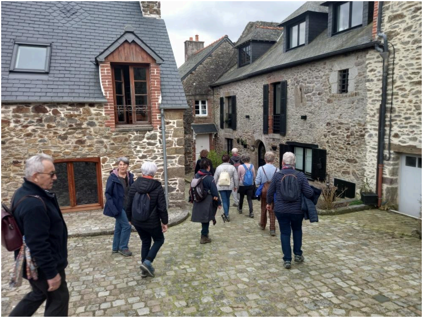
Descente de la pittoresque petite rue du Pontimaron!