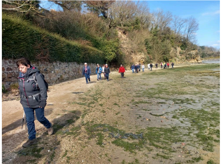
Nous quittons le sentier de la Millière pour rejoindre la vallée Hourdel en suivant la grève!