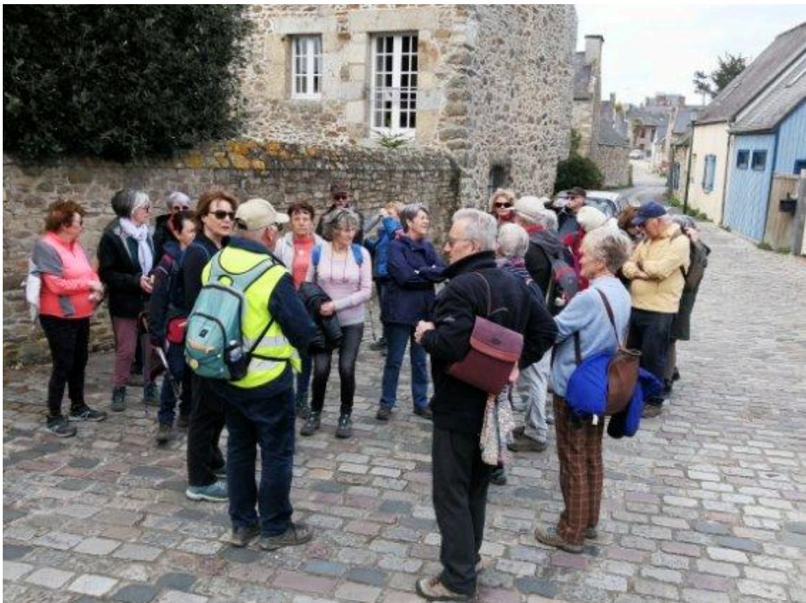
Nouvelle pause place du calvaire!