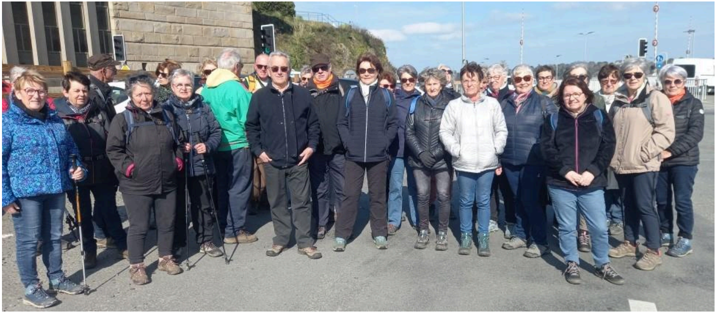
Le groupe de marcheurs avant le départ!