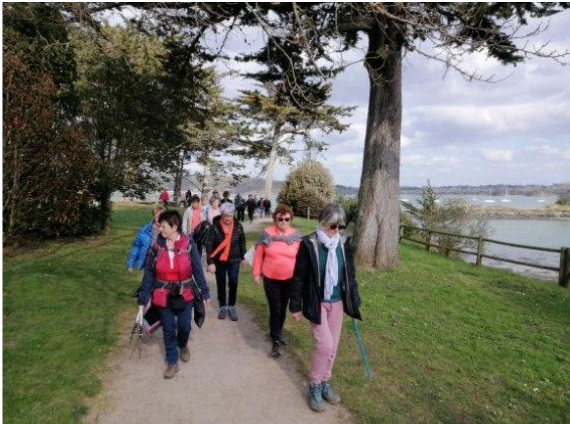
Dans le parc Manoli!