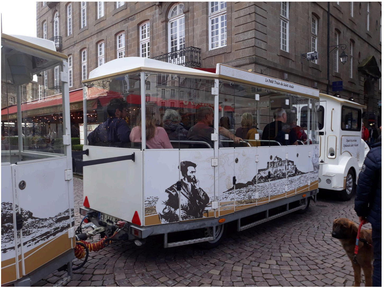
Le petit train toujours complet! (Photo prise par hasard sur le wagon de Jacques Cartier)