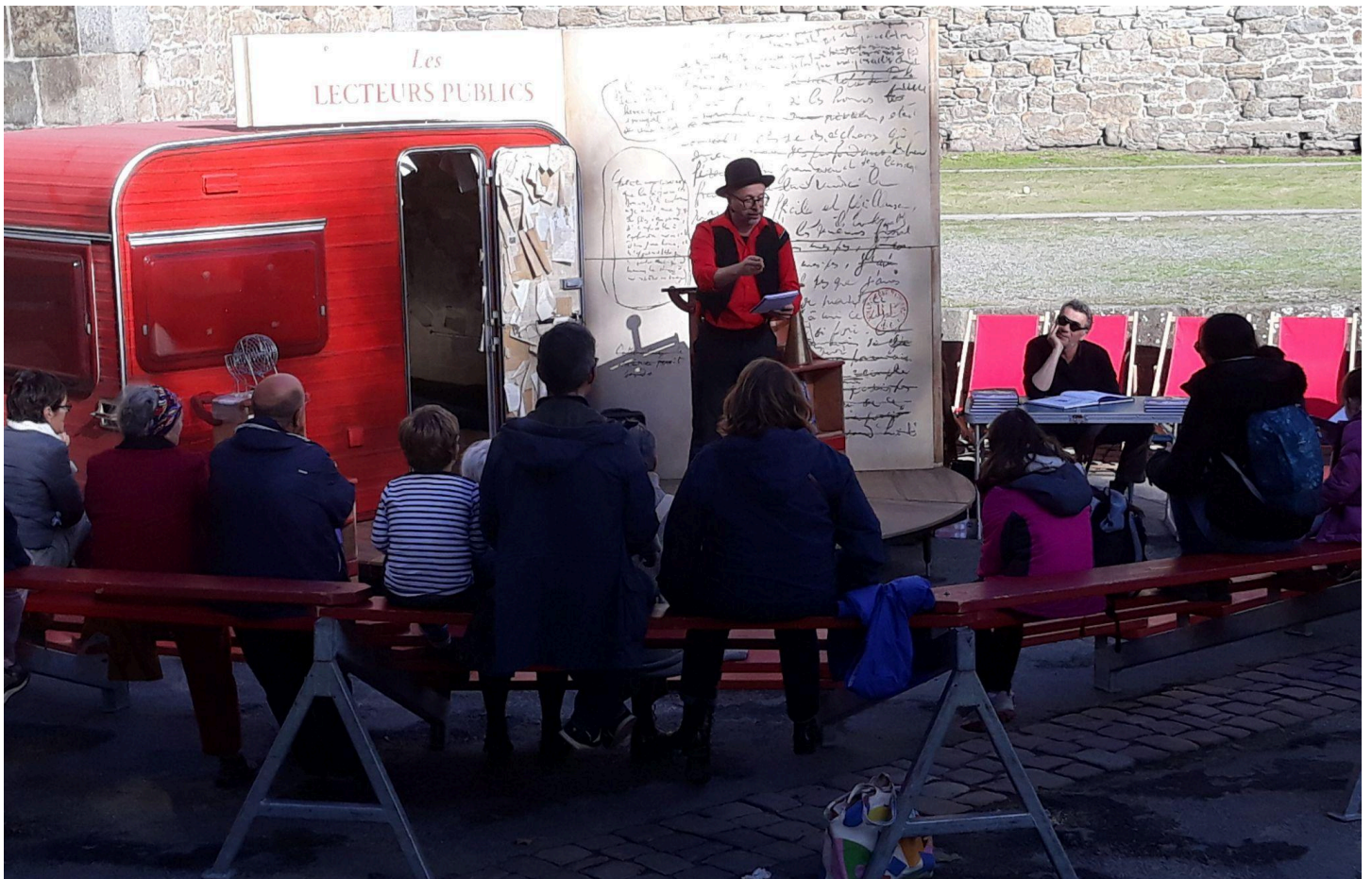
Dans la fosse aux lions, devant le château, un lecteur public fait le spectacle!