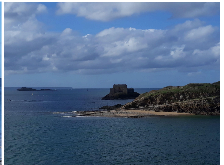
La carte postale du jour! Un tel paysage, on ne s'en lasse pas!