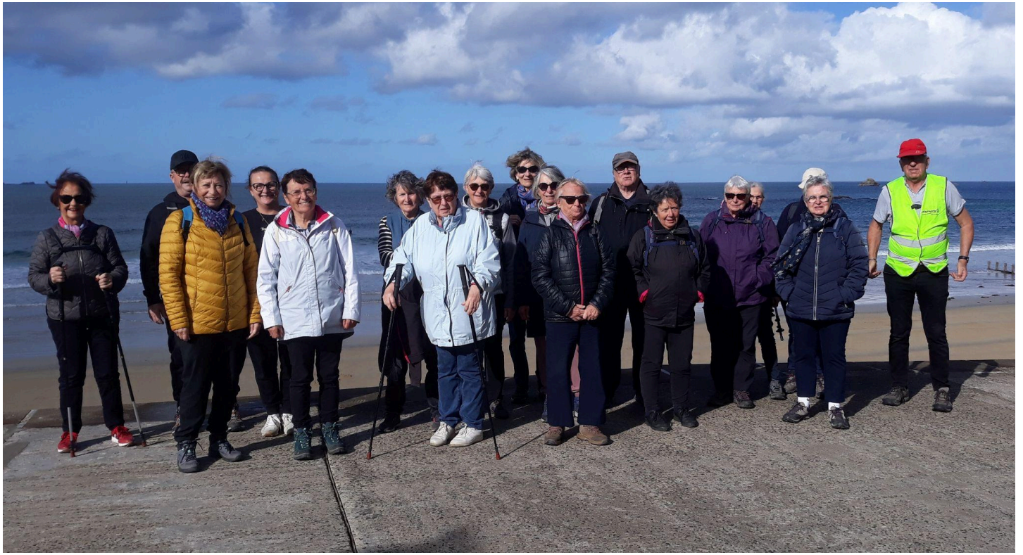
Le groupe sur la digue!