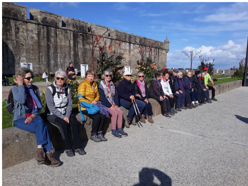
Quelques instants de repos place St Vincent!