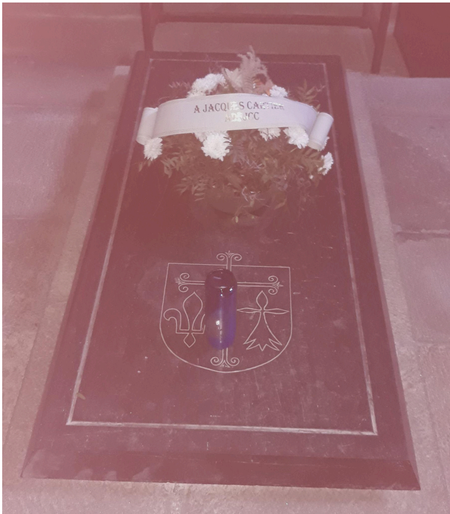
Tombeau de Jacques Cartier, fleuri sans doute pour commémorer la découverte du Canada il y a 490 ans!