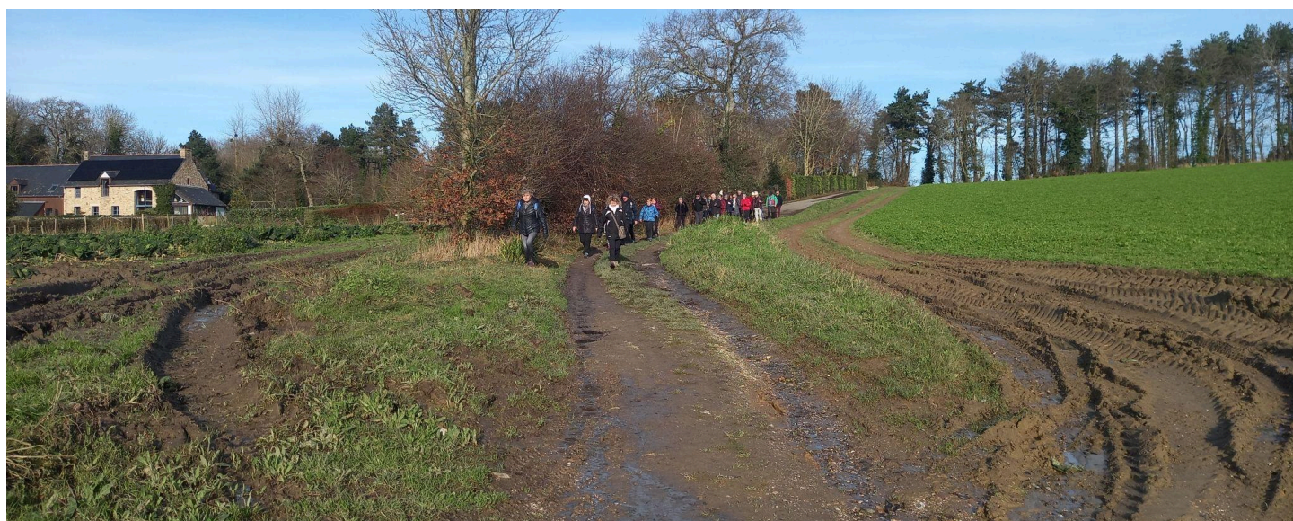
Heureusement, la descente vers la Rance à pu s'effectuer sans soucis, malgré quelques passages boueux, rien à voir avec le vendredi 20 Janvier 2023 ou il n'y avait plus de chemin! (Photo ci-dessous)