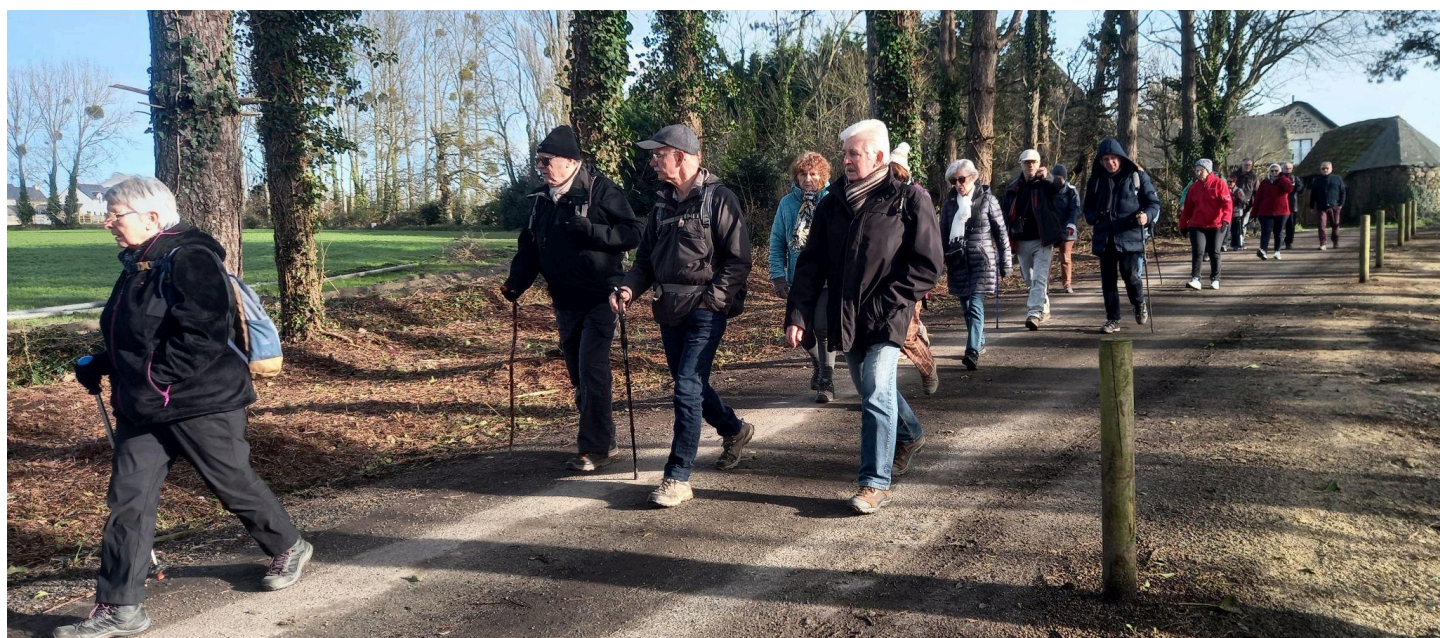
En direction de la ferme de la porte!