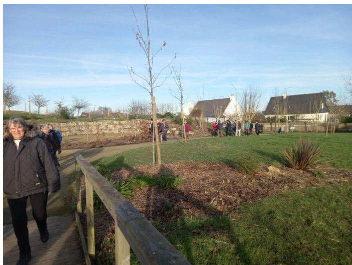
Arrivée par le jardin de la salle Socio-Culturelle!