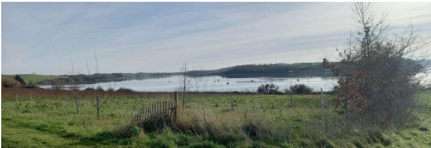
Petite vue d'une Rance étonnamment calme et silencieuse!