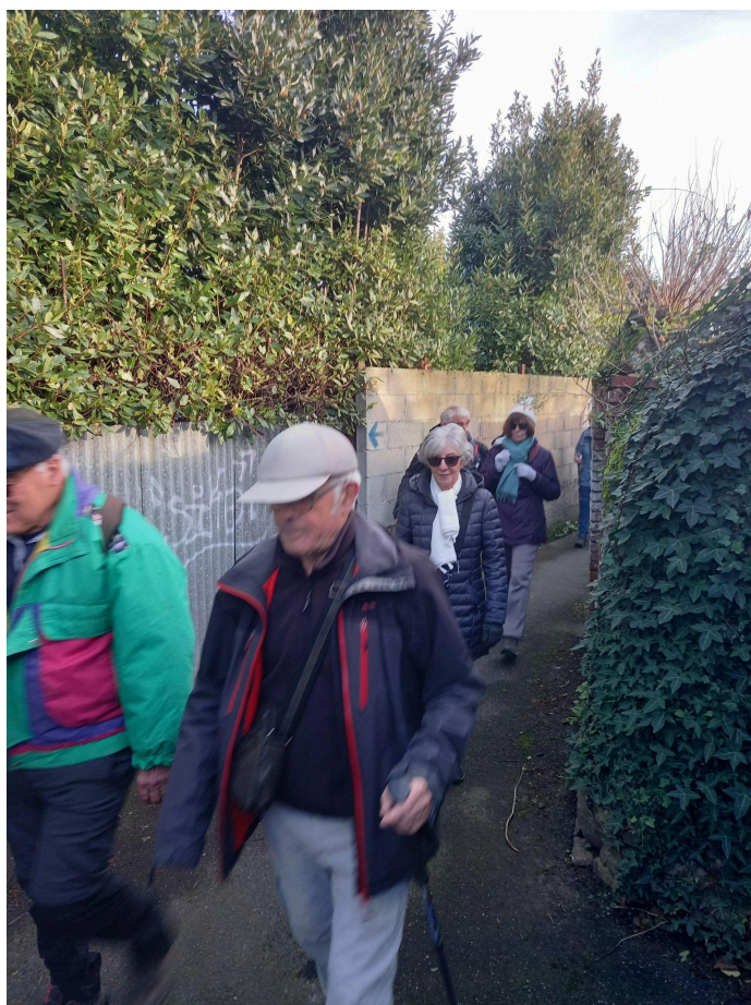
Descente d'un sentier nous conduisant vers la rue Sainte!