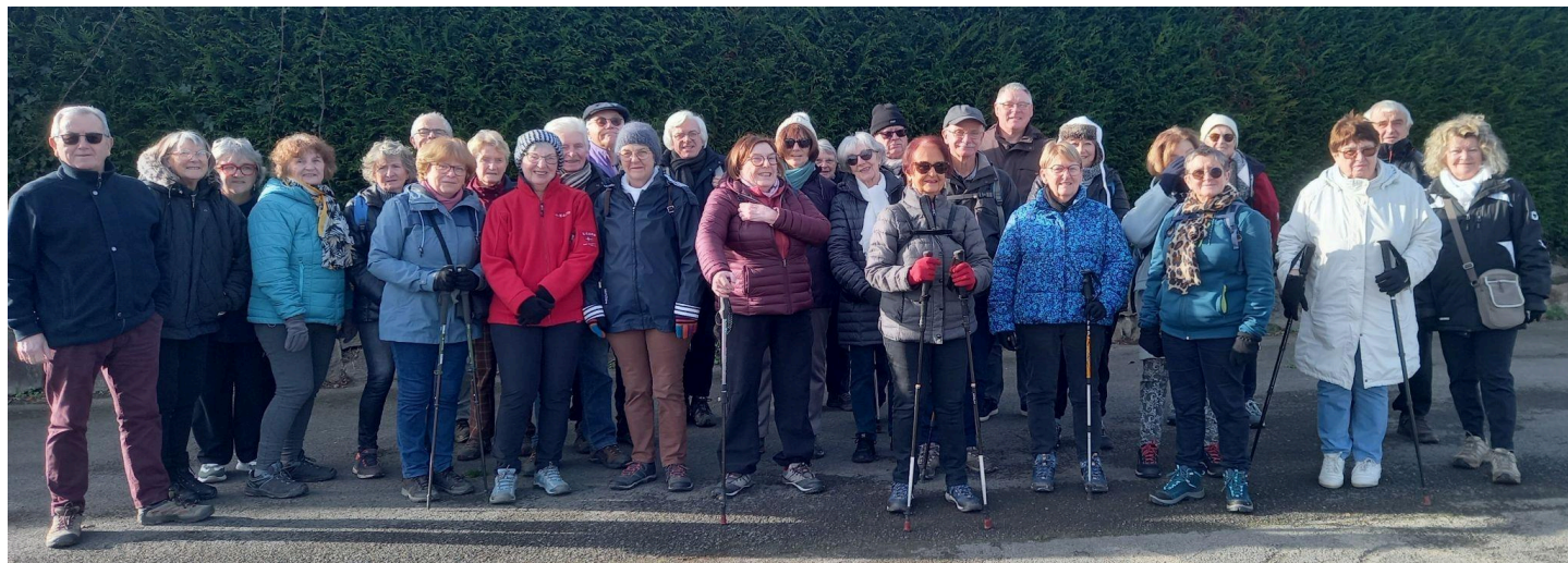
Les premiers participants en RD de 2025!

Alors que le soleil se faisait discret depuis plusieurs semaines, il semble qu'il ait choisi de se montrer aujourd'hui pour nous encourager. Nous avons pleinement profité de sa présence tout au long de notre parcours, recevant ses premiers rayons de chaleur de cette nouvelle année.